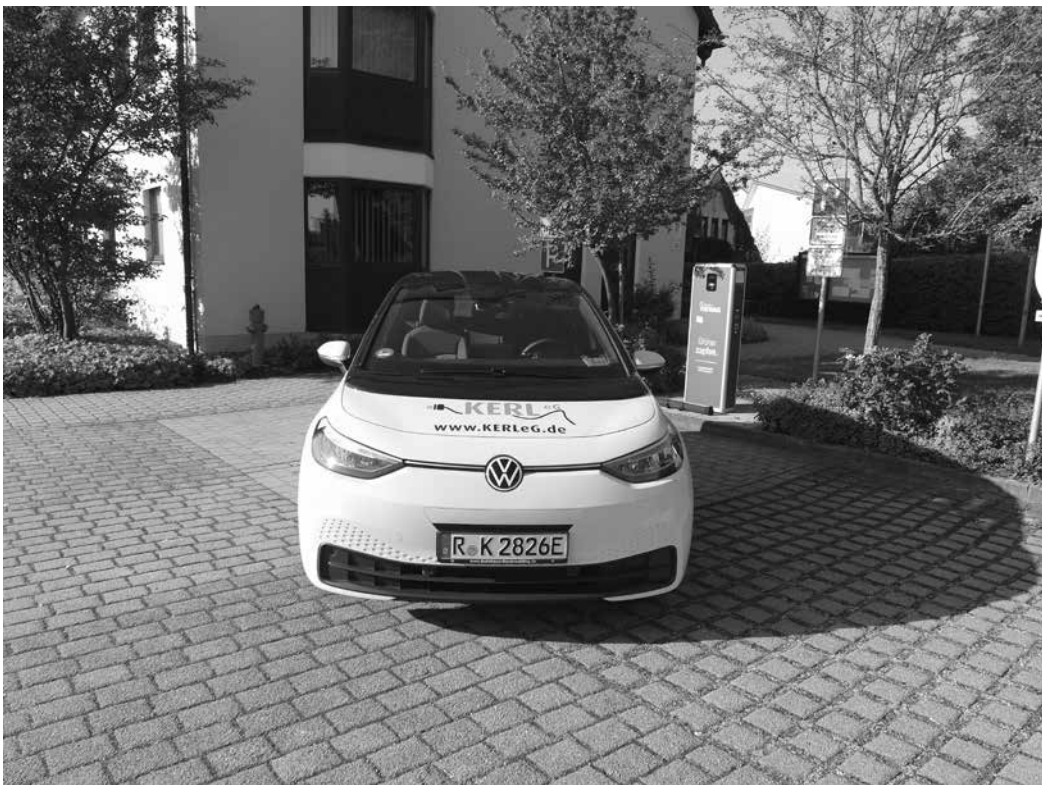
Der VW ID.3 ist in Alteglofsheim stationiert und gehört zur E-Auto-Flotte der KERL eG.

Kontakt: Bei weiteren Fragen steht das Team der KERL eG unter 0941 4009-464 gerne zur Verfügung.