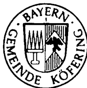
Armin Dirschl Erster Bürgermeister