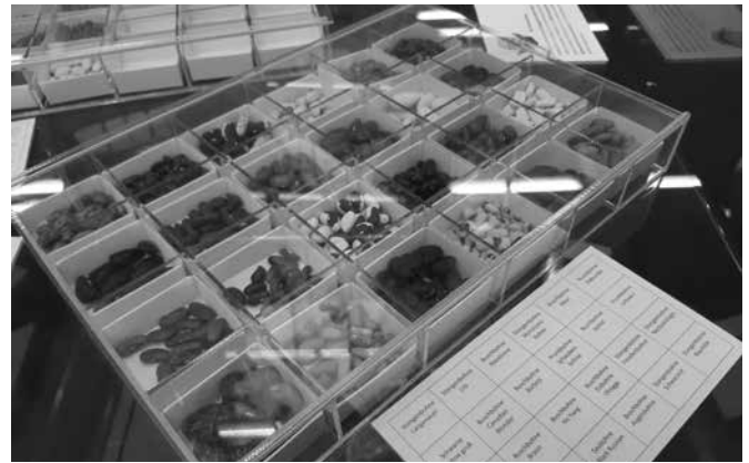
Gartenbegeisterte gesucht, um wertvolle Bohnensorten zu erhalten!

Bei Fragen und Anmeldungen bitte E-Mail an christine.gietl@lra-regensburg.de oder telefonisch bei Christine Gietl, Fachberatung für Gartenkultur und Landespflege, 0941 4009-619