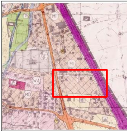
Ausschnitt aktueller Flächennutzungsplan

Nach Erstellung des Vorentwurfs wird dieser samt Begründung und bereits vorhandener umweltbezogener Informationen öffentlich ausgelegt; hierauf wird durch gesonderte Bekanntmachung hingewiesen.